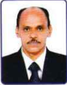
ઉપપ્રમુખશ્રી પ્રતાપભાઈ એચ. ખાંટ ડબોડા વિભાગ