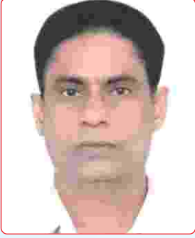
બાબુજી એસ. વાઘેલા ઓડિટરશ્રી રાંધેજ વિભાગ