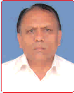
ઉપપ્રમુખશ્રી હસમુખભાઈ સી. પટેલ રાંધેજા વિભાગ