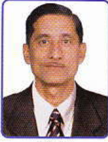
પ્રમુખશ્રી સમૃતલાલ ઠ. દવે સંધેશ વિભાગ