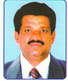
જશુભારથી મ. નાવા રાંધેજા વિભાગ