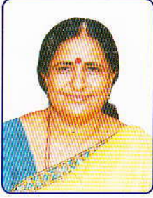
મધુબેન વિ. ચૌધરી અડાલજ વિભાગ