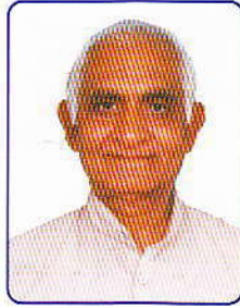
જંચતિલાલ પુ. બ્રહ્મભટ્ટ કાર્યાલય મંત્રીશ્રી રાંધેજા વિભાગ