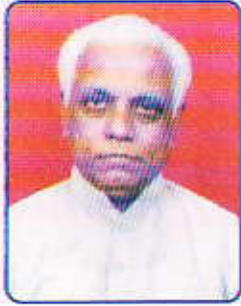
શ્રી નટવરલાલ મં. કાપડિયા સહકાર્યાલય મંત્રીશ્રી