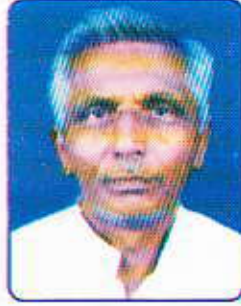
શ્રી જયરમભાઈ મ. પટેલ સહકાર્યાલય મંત્રીશ્રી